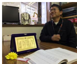
社長ってこんな人ですよ～