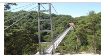
鬼の舌震い ("恋"吊り橋)