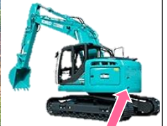
カウンターウエイト 重心を安定させる為の重り