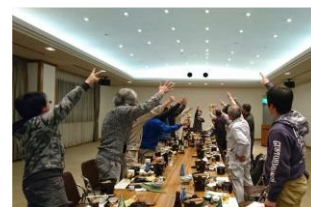
忘年会でジャンケン大会！！