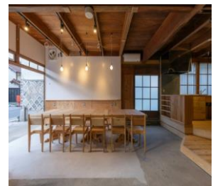
施工例(オフィスみらいと)